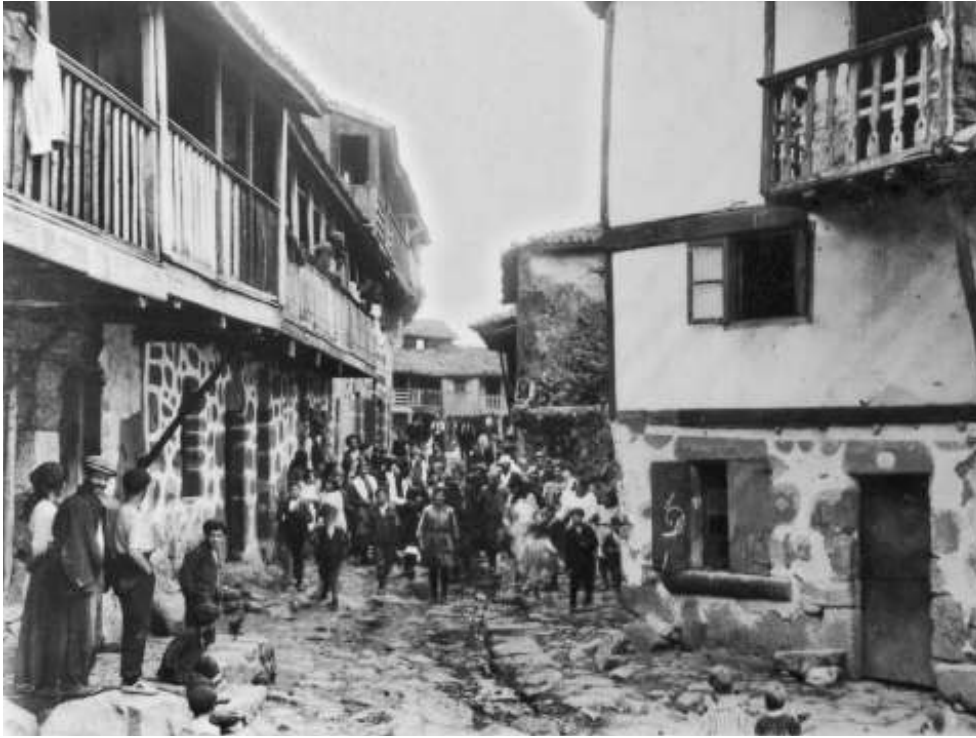
Veciños de Vilanova. a principios do s. XX

Hai nomes, como dicía, que responden a peculiaridades físicas. Para demostralo os alcumadores deixaron motes coma o Coleta, o Cu de Pombo, o Morrudo ou o Perna de pita. E como non, o tan simpático as Tres Pelos.