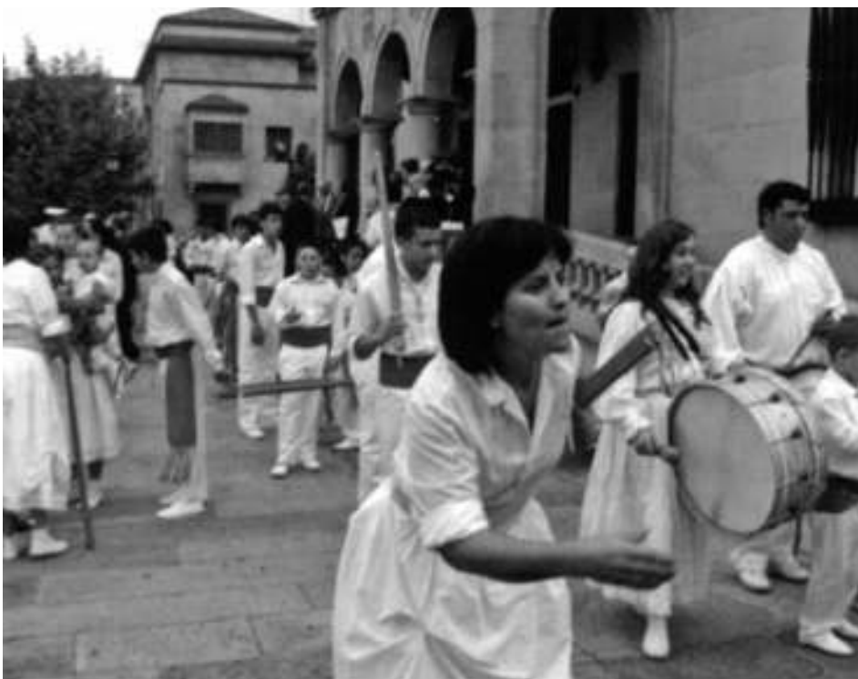
Detalle da Danza das Espadas de Marín. Muller danzante

A danza, que nun principio era exclusivamente masculina, conta hoxe entre os seus danzantes con mulleres, igual que a grande maioría das danzas gremiais e relixiosas que todavía se manteñen no noso país, convertíndose nun garante de continuidade deste peculiar elemento do noso folclore. As mulleres danzates de Marín visten enaguas brancas en troques dos pantalóns dos homes.