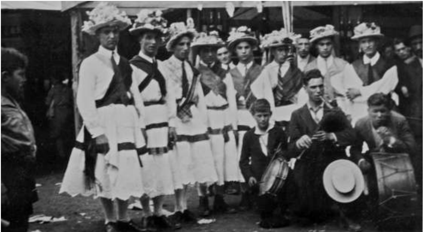
Os Danzantes de Vilanova cos músicos, compoñentes da Banda, que aínda hoxe son os encargados de tocar a danza cada 15 de Setembro. Foto de 1926