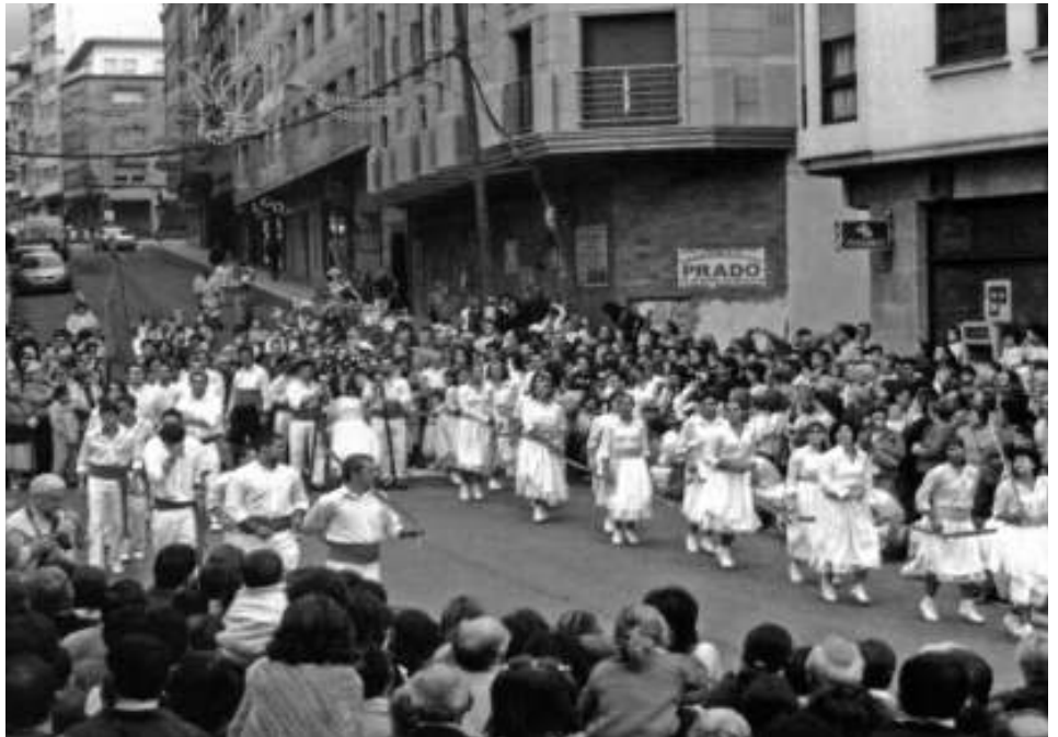
Danza das Espadas de Marín descorrendo polas rúas da vila

A danza execútase cun número variábel de elementos que pode ir dende os 24 até os 50 danzantes, 1 animador