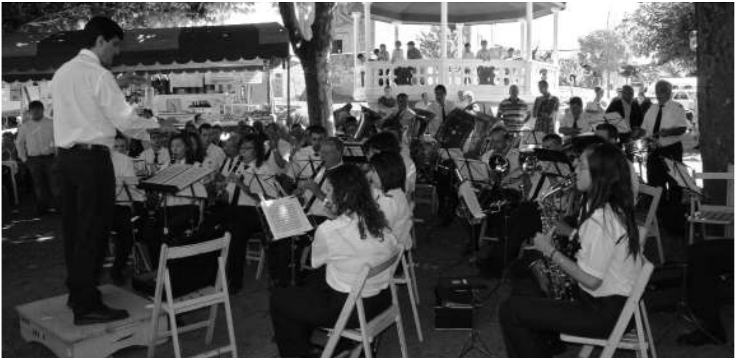
A Banda de Música de Vilanova na romaría do Cristal de 2008